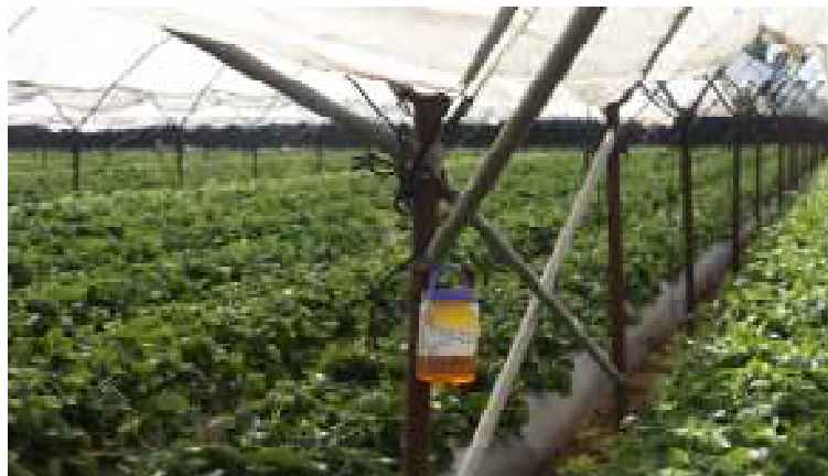
Trapeo en cultivo de fresa

Durante el mes de marzo, se revisaron un total de 400 trampas tipo cubeta instaladas en predios de producción ubicados en el Valle de San Quintín, municipio de Ensenada. En porcentaje de cumplimiento respecto a lo programado en el mes tenemos un resultado del 100 %.