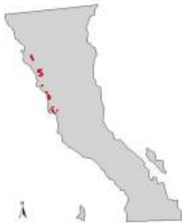
Red de trapeo de Drosophila suzukii

Con el objetivo de medir presencia de mosca del vinagre de las alas manchadas, se encuentra instalada una red de trapeo de 100 trampas a cargo del Comité Estatal de Sanidad Vegetal, distribuidas en predios de producción en el municipio de Ensenada.