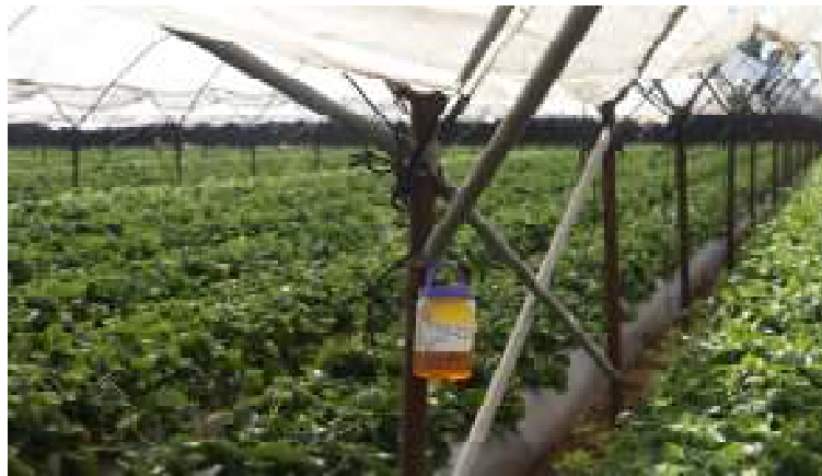
Trampeo en cultivo de fresa

Durante el mes de enero, se revisaron un total de 500 trampas tipo cubeta instaladas en predios de producción ubicados en el Valle de San Quintín ,municipio de Ensenada. En porcentaje de cumplimiento respecto a lo programado en el mes tenemos un resultado del 100.00%.