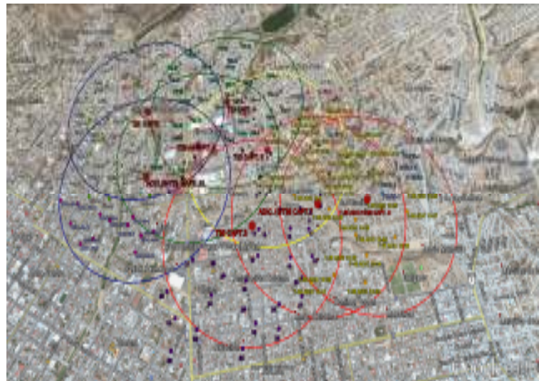
Área delimitada (capturas 3,4,5 , 6 , 7,8, 9 y 10) del Brote 1/2014.

Control químico. Se aplicó un total de 2,015 lts de mezcla en 3,200 has acumuladas. Como parte complementaria de control, también se instalaron estaciones cebo, a la fecha son 220 activas . Plan de emergencia activo.