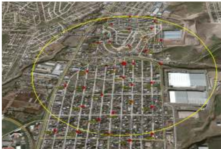
Área delimitada y trampas instaladas de la Detección 2/2015

Control químico. Fueron asperjados 160 lts de insecticida. Con estas acciones El Plan de Emergencia se concluye.