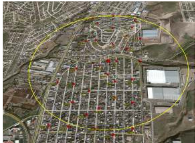
Área delimitada y trampas instaladas de la Detección 2/2015

Control químico. Fueron asperjados 60 lts de insecticida. El Plan de Emergencia se encuentra activo.