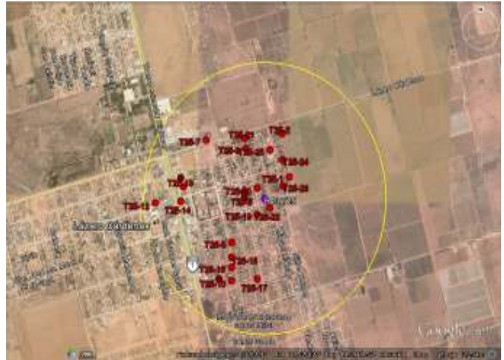
Área delimitada y trampas instaladas del Brote 1/2015

Control químico. Fueron asperjados 120 lts de insecticida. Concluye el Plan de Emergencia.