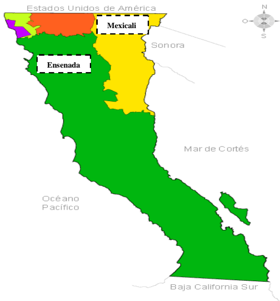
Zona Libre de Moscas Exóticas de la Fruta