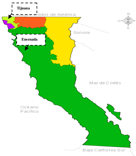
Municipios con operación de plan de emergencia en las Zonas libres de moscas de la fruta.